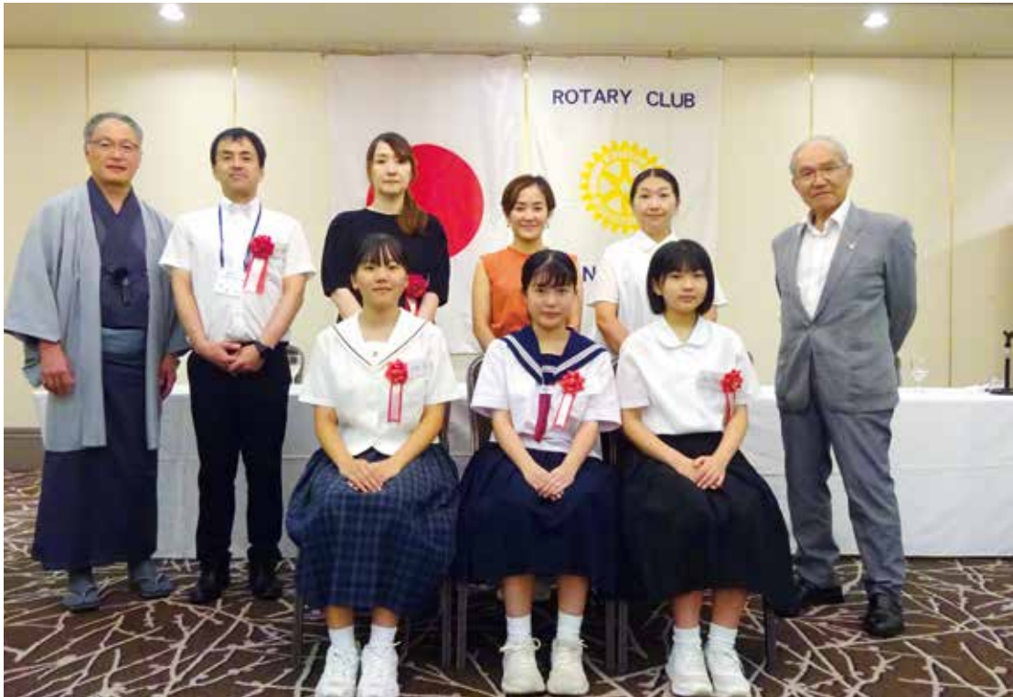
中学生弁論大会報告 8月8日